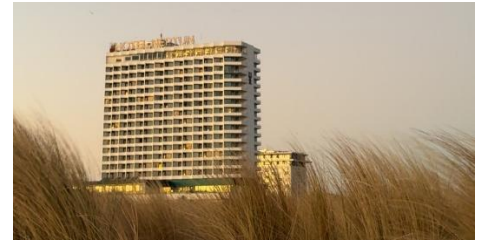
Veranstaltungsort: Hotel Neptun an der Ostseeküste

Weitere Informationen erhalten Sie mit der Einladung in den kommenden Wochen.